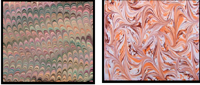
شكل ( ٣ ، ٤ )

وجماليات هذا الأسلوب تعتمد علي مسافه التباعد بين أسنان المشط فكلما كانت الأسنان متقاربه أعطت تأثيرات أدق وكلما تباعدت يحدث العكس شكل (٤) (١٧).